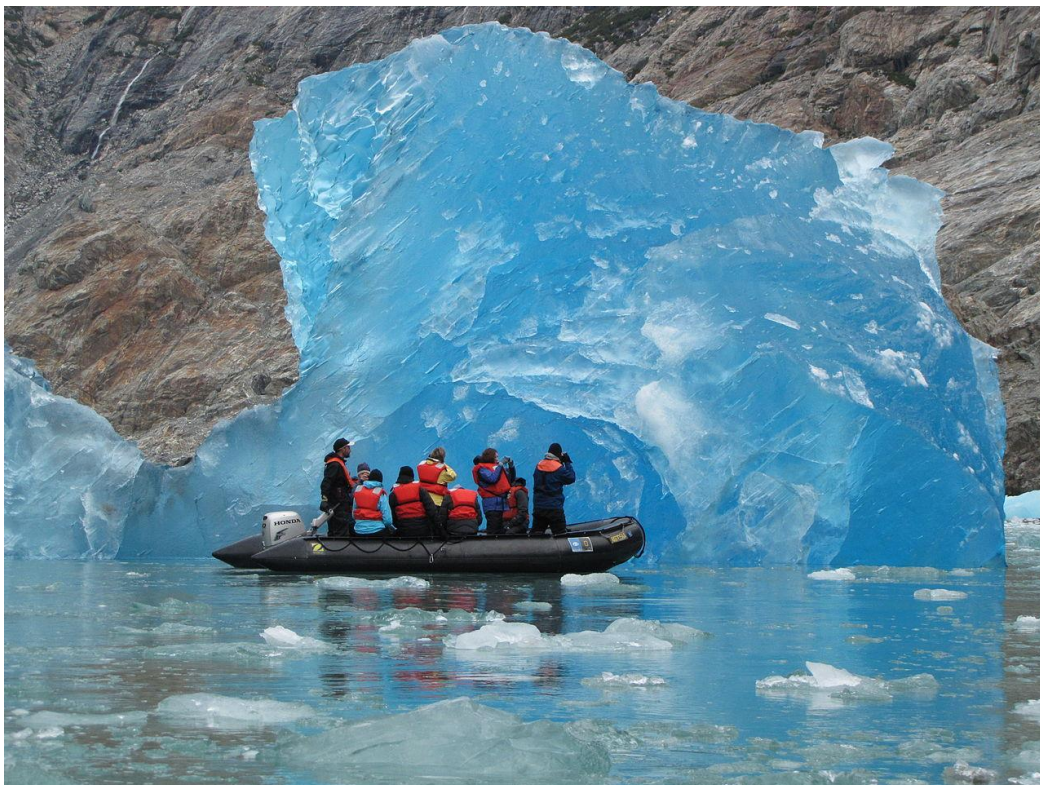
Bron 2: Blauw gletsjerijs in een ijsberg voor de kust van Alaska. Gletsjerijs is blauw omdat de zuurstof-waterstof verbindingen in ijs (net als in water) het rode deel van het licht absorberen.

Meerjarige sneeuw of firn verandert onder invloed van het proces van inklinking. Door het toenemende gewicht van de steeds groeiende firnlaag neemt het luchtgehalte steeds verder af en de ijskristallen worden effectiever gestapeld ( settling ). Als de druk toeneemt gaan de ijskristallen samenklonteren en veranderen ze van vorm ( sintering ). Bij een nog verdere toename van de druk worden de poriën tussen de ijskristallen, waarin zich lucht bevindt, afgesloten. Luchtbellen zijn vanaf dat moment ingesloten tussen de ijskristallen (zie bron 3). Er is gletsjerijs ontstaan. Gletsjerijs heeft een lichtblauwe kleur. De dichtheid van gletsjerijs is vele malen groter dan de dichtheid van vers gevallen sneeuw. Vanaf een dichtheid van 830 \text{ kg/m}^3 tot de maximale dichtheid van 900 \text{ kg/m}^3 spreken we van gletsjerijs.